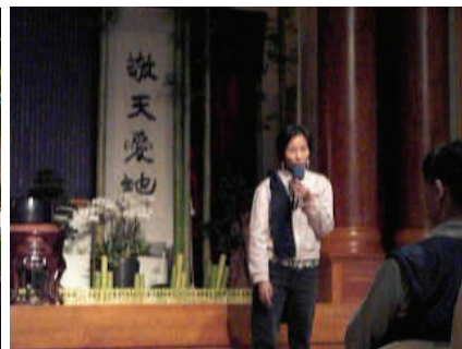
(97.11 月) 慈濟環保站舉辦的歲末圍爐，邀請住民朋友上台發表感言