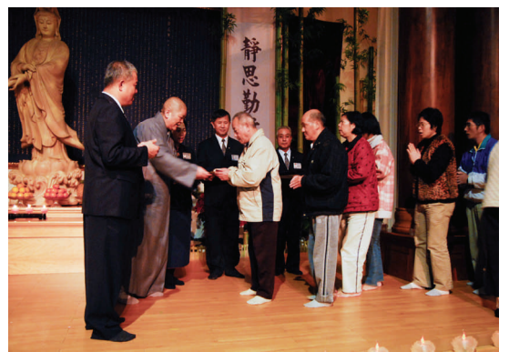
(97.12.10) 慈濟關渡環保站舉辦歲末祝福，每個人都受到真心的祝福，明年真美好！