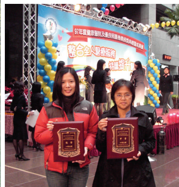
(97.12.5) 演慈與奇岩北市督考得佳績，今年又雙雙獲獎