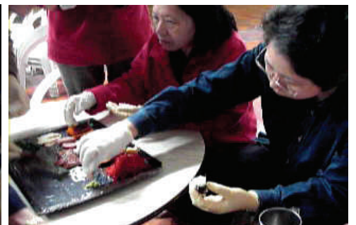
(97.12.12) 前往大愛媽媽-新素食儀包壽司，成品在肚子裡，成果在幸福的表情中