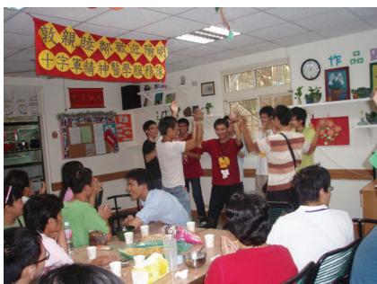
(97.11.1) 陽明十字軍精醫隊計畫來訪，與住民共同規劃周末茶會