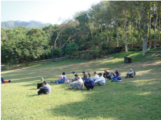
(97.11.21) 秋季旅行前大家決定去飛牛牧場，住民自組「康樂園」包辦全程大小事！