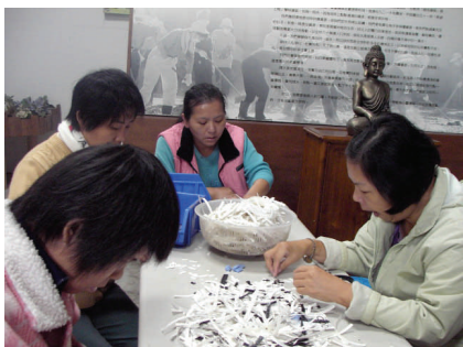
(97.11.18) 前進三重！環保新朋友